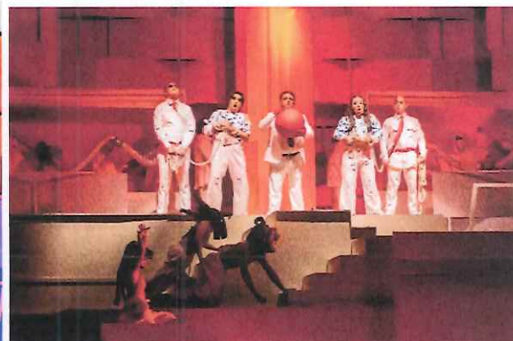
Tercer Acto, Solistas y Ballet Moderno y Folklórico