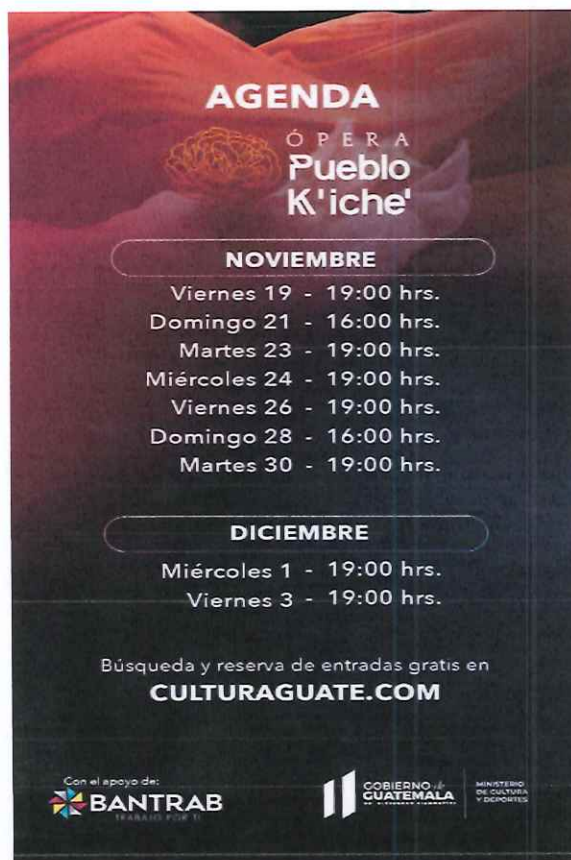
Afiche del Ministerio de Cultura – Segunda Temporada