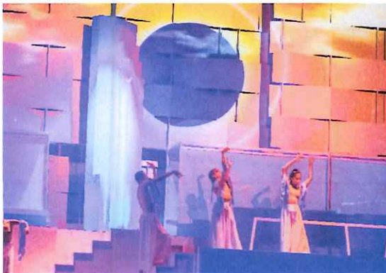
Segundo Acto, Ballet Moderno y Folklórico

De este modo, los referentes estéticos se enmarcan en los montajes contemporáneos que se desarrollan en la actualidad en la mayoría de escenarios alrededor del mundo.