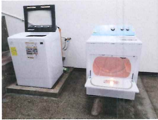
Lavadora y Secadora instaladas en Centro Cultural Miguel Angel Asturias

El vestuario de los solistas, requirió de un involucramiento mayor del Diseñador de Vestuario, debido a los muchos detalles que tenía el mismo, tales como botones, aplicaciones, texturizados, etc.